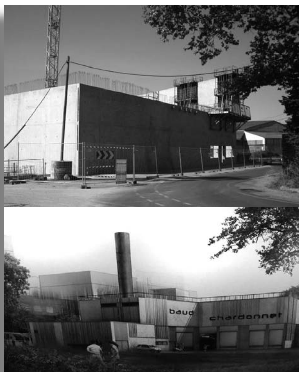
Photo-montage de la future usine