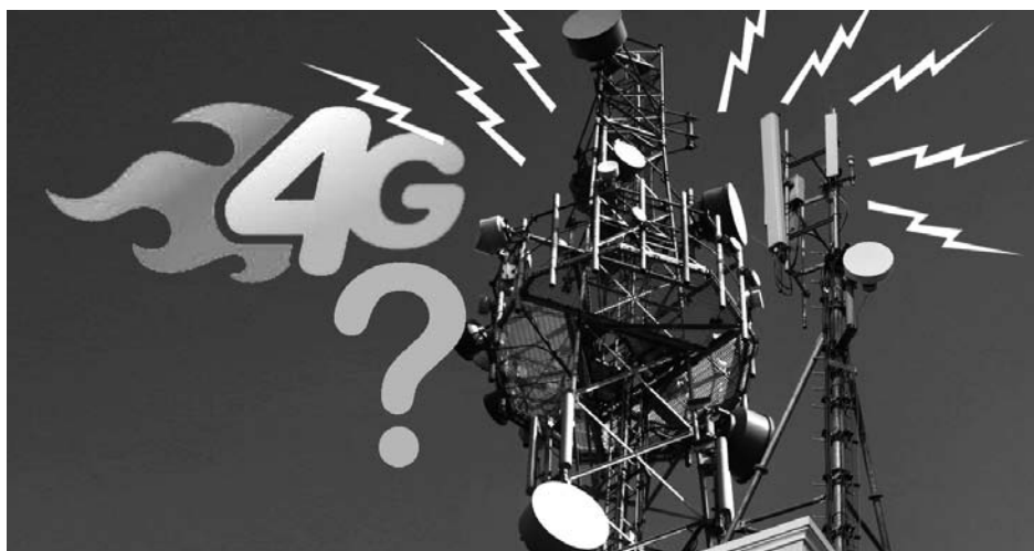
Les arbres du futur

C'est l'éternelle question que nous nous posons devant chaque saut technologique, avec ses nouveaux usages et ses éventuels risques... Quoiqu'il en soit, il est critique de ne pas oublier que le moyen de communication le plus fantastique est la 0G : frappez à la porte de votre voisin, de vos proches, de vos amis et échangez avec eux... vous verrez c'est tellement immédiat et enrichissant !