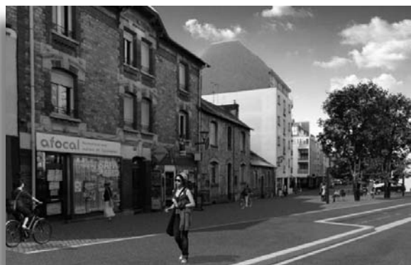
Future placette à l'extrémité Est du quartier