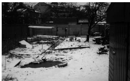
le jardin sous la neige

Nous vous signalons que nous avons d'ailleurs quelques places de disponibles pour ceux qui souhaiteraient se joindre à nous. En effet quelques jardiniers ont dû faire une pause faute de temps libre. N'hésitez pas à venir nous voir.