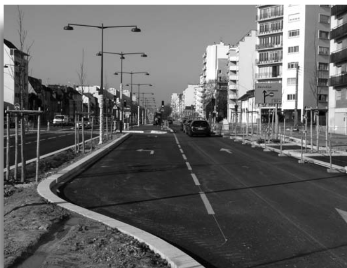
La future voie d'accès à notre quartier

La fin de ces travaux devrait se situer avant mai 2013 et l'ensemble des travaux de l'axe Est-Ouest devrait être terminé en septembre 2013.