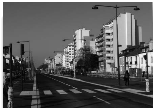
Les voies de circulation ouvertes.

à des conditions météorologiques défavorables (fortes pluies en novembre et en décembre) ont mis en péril une ouverture à la circulation qui aurait été trop précipitée à l'approche des fêtes de fin d'année, car présentant trop de risques pour les riverains et les usagers.