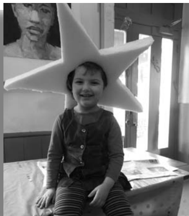
Rose la mascotte du village d'Alfonse