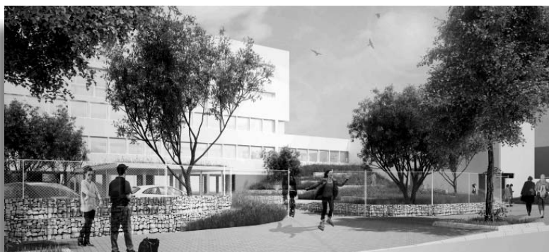
Entrée face à l'Espace des 2 Rives

En septembre 2015, les élèves et leurs enseignants pourront profiter d'un CDI flamboyant neuf et de salles de travail attenantes, les agents de service disposeront de locaux adaptés, les élèves de lieux de détente plus spacieux et les usagers d'un lieu d'accueil plus fonctionnel dans un environnement végétalisé tant du côté cour que du côté rue.