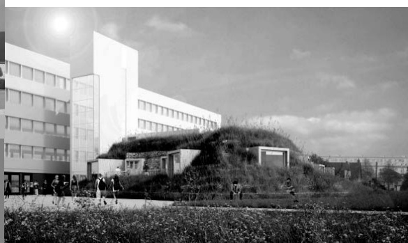
CDI, service « vie scolaire » et lieux de vie des élèves