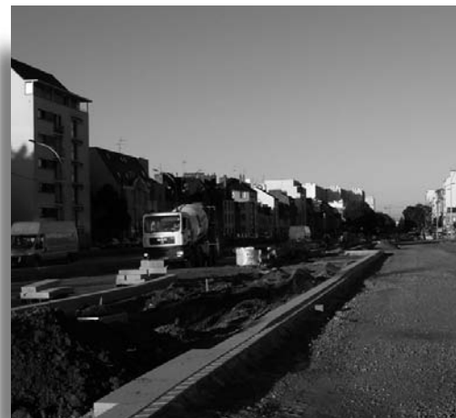
L'ancien parking central et les futures voies de bus.

• Plus à l'Ouest, des travaux seront également engagés fin 2012, sur le mail F. Mitterrand