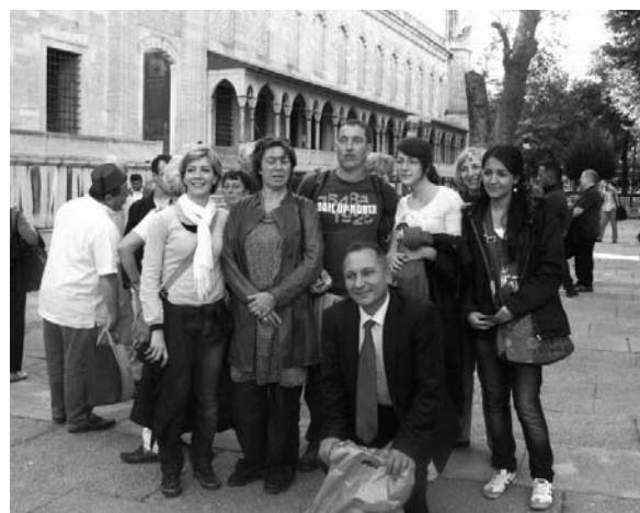
Les élèves et leurs enseignants en Turquie

F.Garnier, enseignant de lettres-histoire