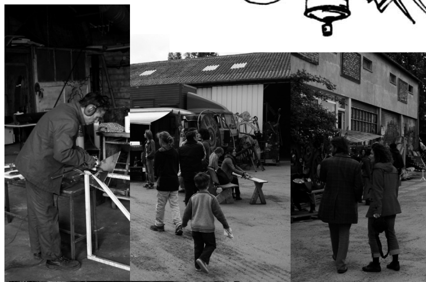
Un aperçu du week-end l'ART&PUBLIC N°1