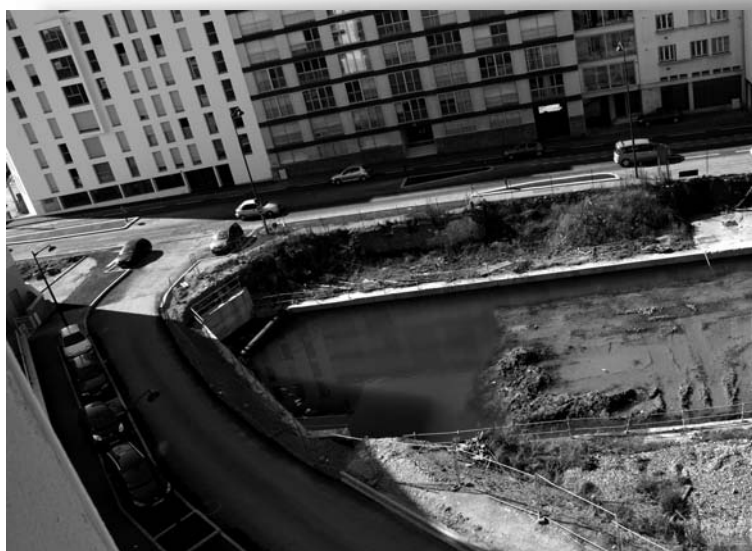
Le boulevard Villebois-Mareuil et l'entrée de la rue Jeanne Malivel à l'époque de la piscine.

* Brieuc, Malo, Samson, Patern, Corentin, Pol-Aurélien, Tugdual