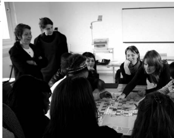
En pleine partie d'Armorisk